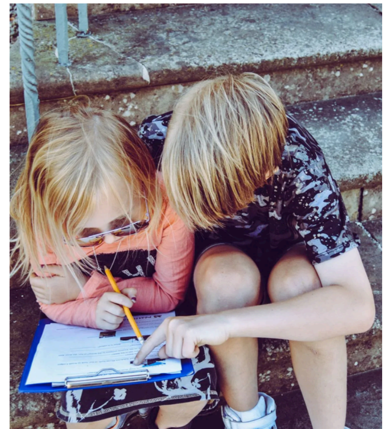
La formation et l'information